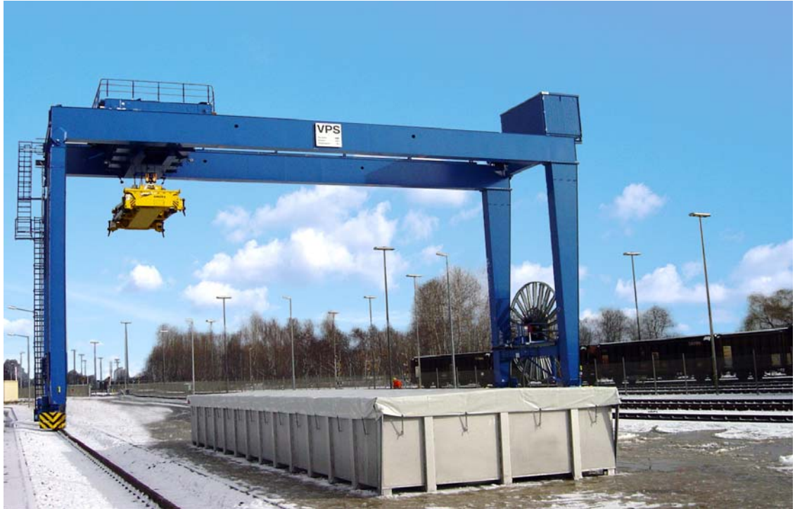
Bild 5 Güterverteilzentrum VPS Salzgitter