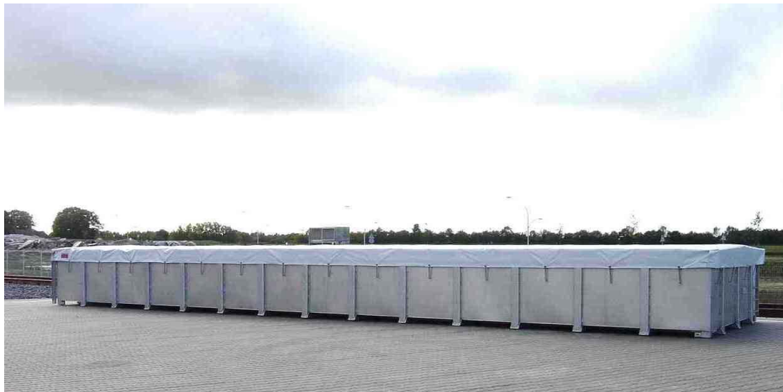
Bild 3 EuroTerminal NL - Coevorden; mobile Leckagewanne neuester Generation für Container bis zu einer Länge von 45-foot