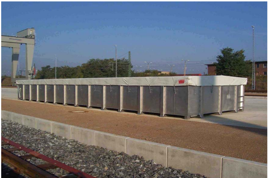
Bild 6 Güterverteilzentrum Dresden