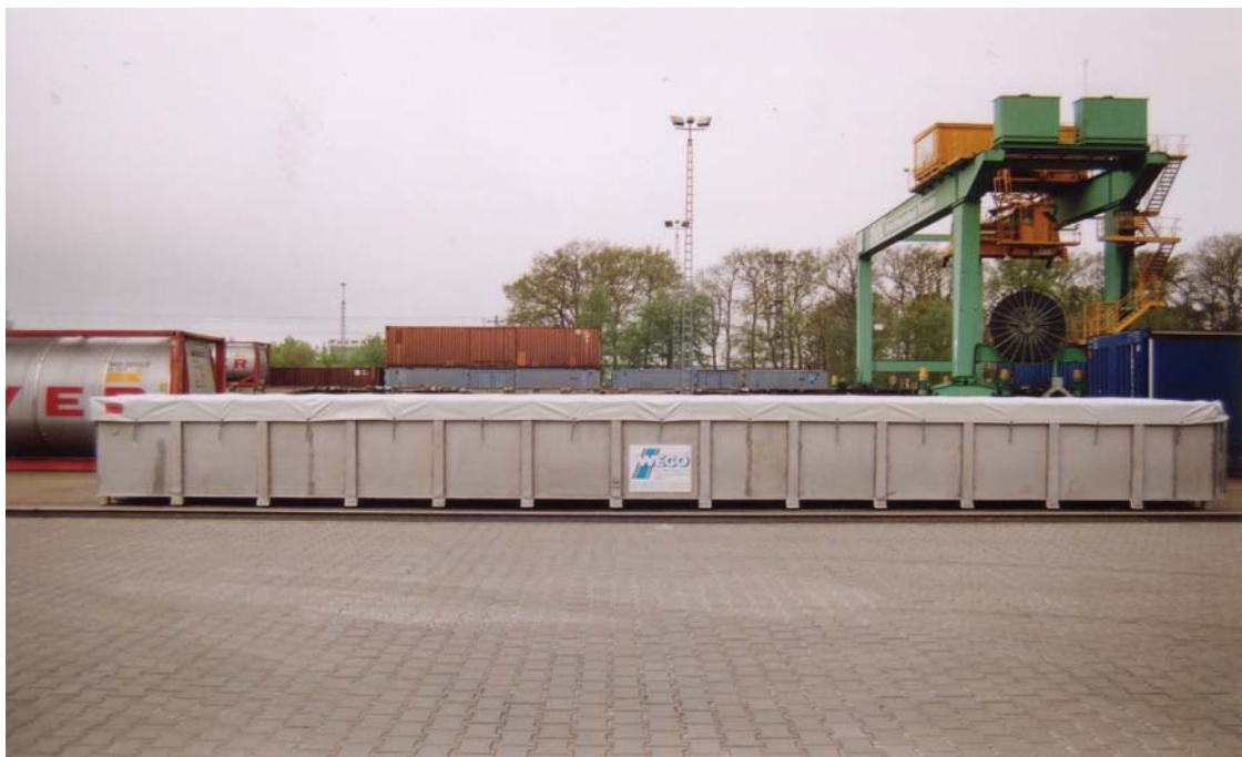
Bild 1 40-foot Leckagewanne DUK Dörpen zur Aufnahme von 20-foot, 30-foot und 40-foot Container Abmessung: L x B x H, 13.000 mm x 3.500 mm x 1.100 mm