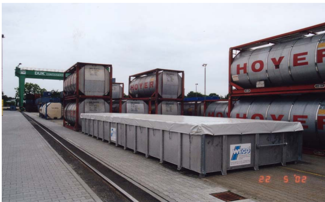
Bild 2 Ausstattung mit Spezial-Schiebeverdeck