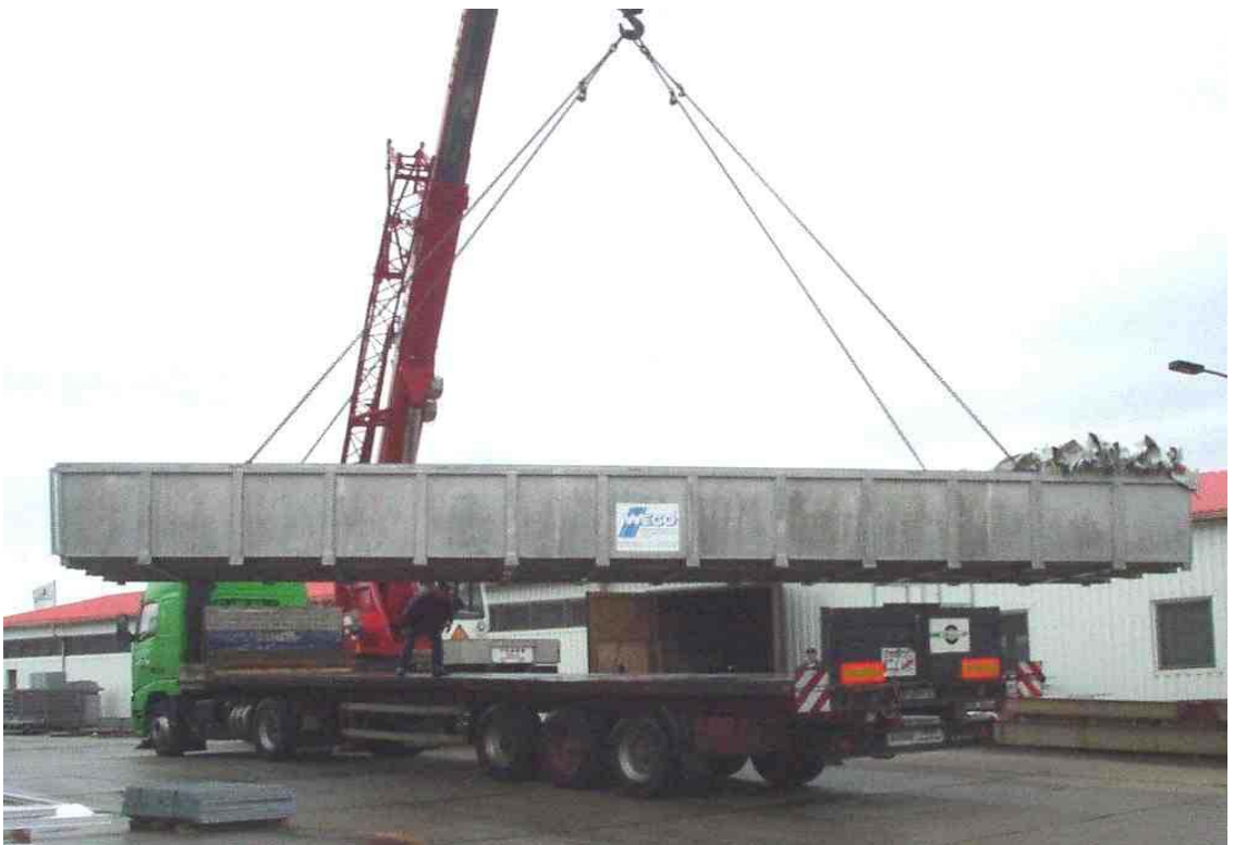
Bild 10 Möglichkeit der Kranung der Leckagewanne