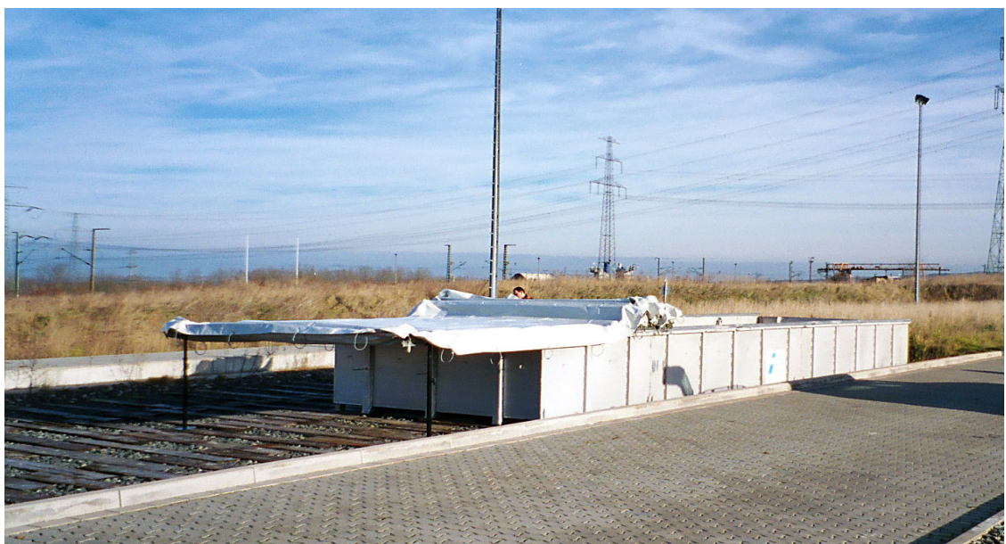
Bild 8 Güterverteilzentrum Erfurt - Vieselbach