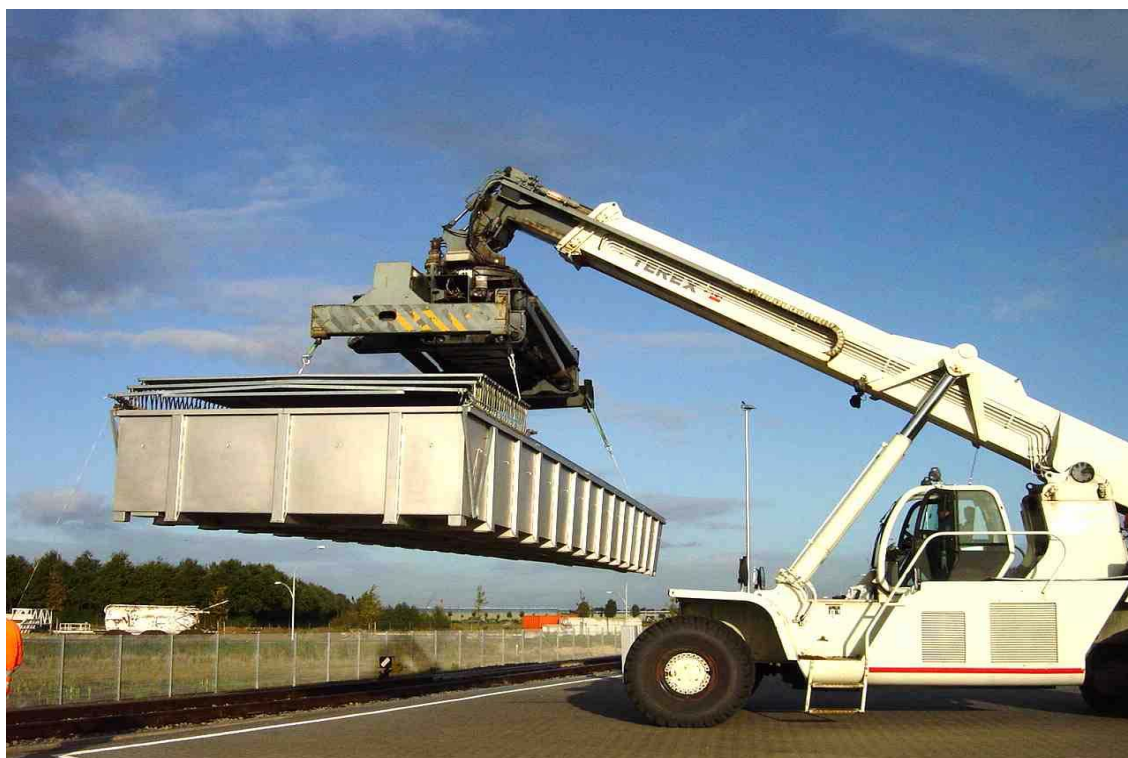
Bild 4 Transport einer 45-foot Leckagewanne mit einem Reachstacker