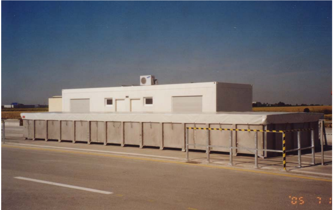
Bild 7 Güterverteilzentrum Ulm - Nord